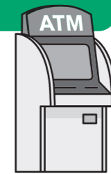
※ATMでの申請には 健康保険証は不要です。

ATMからの 申請が最も簡単です。 24時間対応で、 手数料無料ででき、 申請時間は 約2分間ほどで 完了します。