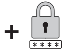
利用者証明用 パスワード(4桁)